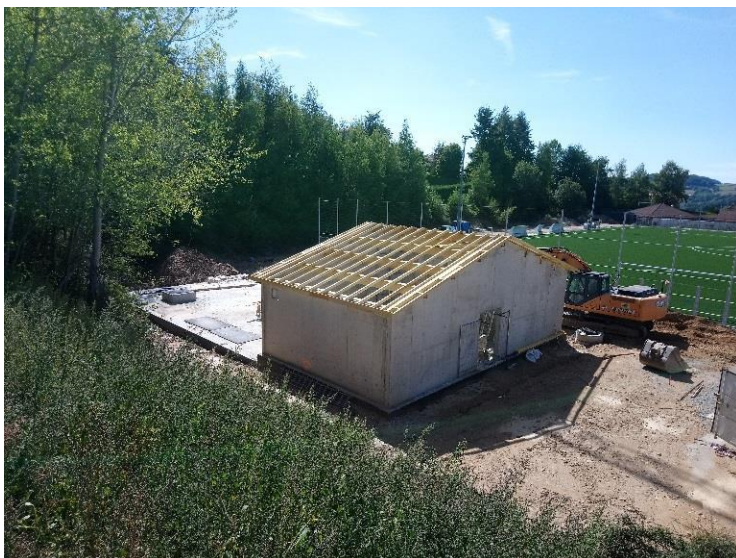
Bassin de stockage réalisé-St Martin en Haut

Ce rapport est présenté conformément à l'article L.2224-5 du code général des Collectivités territoriales. Ce rapport doit être soumis, pour approbation , au Conseil Communautaire.