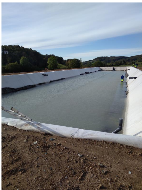
Travaux construction station d'épuration de Duerne

Le transfert de la compétence assainissement de l'ensemble des communes du territoire sera effectif au 01/01/2020.